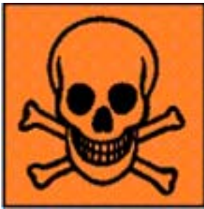
T+ / T Altamente Tossico / Tossico

Rischi per la salute, dovuti all'interazione tra sostanza e organismo umano: