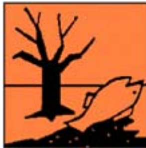
N Pericoloso per l'Ambiente

Rischi per l'ambiente, dovuti all'interazione tra sostanza e ambiente: